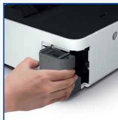
Tanque de manutenção