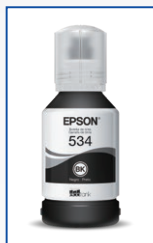
Até 6.000 páginas