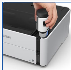
Novo sistema de abastecimento EcoFit™