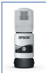
Até 2.000 páginas